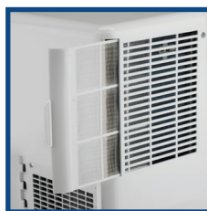
Filtro dell'aria lavabile, facilmente rimovibile Washable air filter, easy to remove