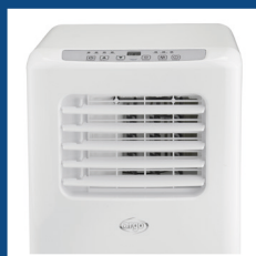
Alette regolabili in senso verticale Vertically adjustable flaps