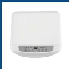
Pannello comandi digitale con display a LED Digital control panel with LED display

Its size and low weight make it easy to move around. Suitable for cooling modest spaces, it has a minimal aesthetic that makes it easily integrated into any living space.